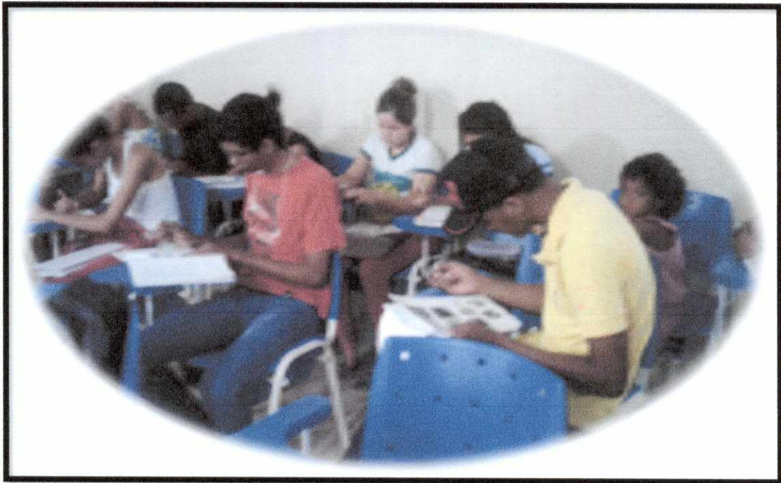
Los alumnos haciendo actividad sobre los puntos turísticos