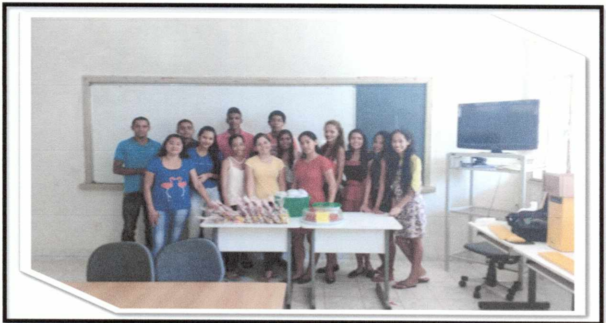
El enceramamiento del curso