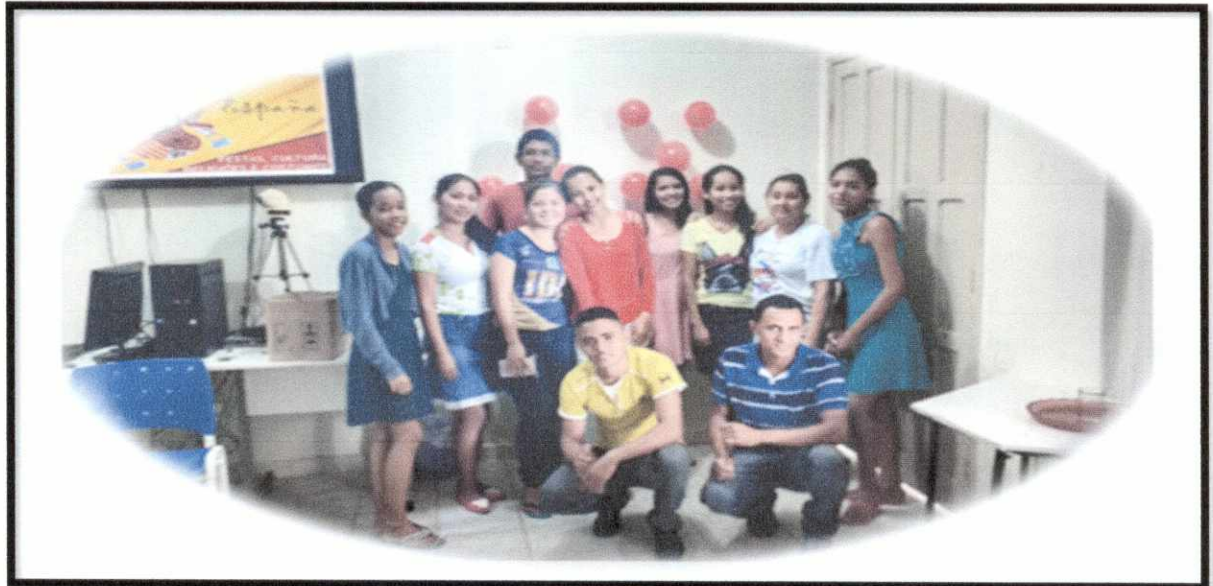
Primero día en la clase.